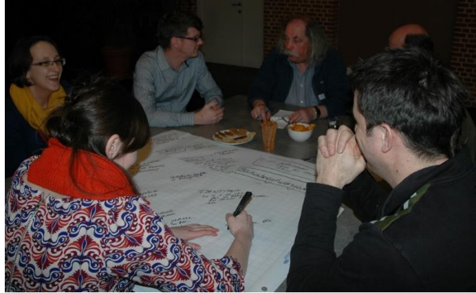
Foto: Samen brainstormen over bedelzang.

Bedelzanggebruiken zijn levende tradities. Het is daarom belangrijk dat we niet enkel naar het verleden kijken maar ook onze blik richten naar de toekomst. Door de uitwerking van enkele projecten willen wij daarvoor zorgen dat er nog lang gezongen kan worden in onze streek. In maart gingen we van start met een ideeëncafé . Iedereen was welkom om samen met ons mee te denken. De aanwezigen namen deel aan een rondetafelgesprek waar per groep een