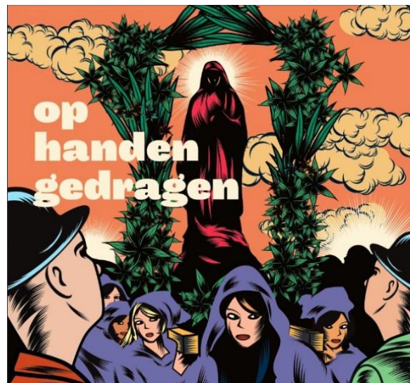
Net zoals het boekje “Op handen gedragen” (dat het grote publiek informeert over processies en omgangen) zal er een inspiratiebrochure verschijnen over bedelzang.

Op de website komt ook de digitale versie van de inspiratiebrochure . Tijdens het ideeëncafé werden wij overrompeld door een hoog aantal concrete en originele projectvoorstellen. Die inspirerende voorbeelden bundelen we in één gids. Het zijn succeservaringen van groepen of verenigingen die een vernieuwende aanpak rond hun bedelzangtradities hebben ontwikkeld. De inspiratiebrochure schrijven wij in samenwerking met LECA vzw (Landelijk Expertisecentrum voor de Cultuur van Alledag). Deze erfgoedgids heeft als doelpubliek elke vereniging of groep die zelf de handen uit de mouwen wil steken en een evenement wil organiseren rond de bedelzangtradities. De papieren versie van dit boekje zal in het najaar over heel Vlaanderen verspreid worden.