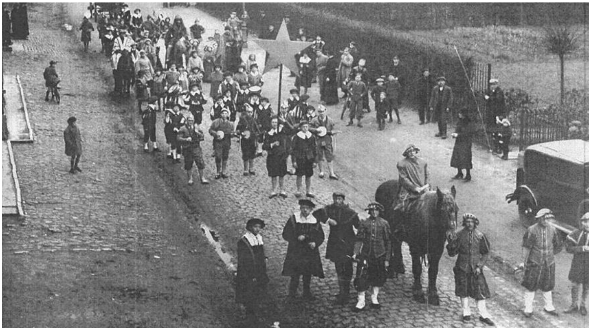
Foto: Driekoningenstoet van eind of begin 1936 te Geel.

Om alvast een tipje van de sluier te lichten willen wij eindigen met een spannend erfgoedverhaal. Bedelzangtradities zijn vreugdevolle gebruiken waar solidariteit, delen en onschuld centraal staan. Niet overal was dit echter zo. Al sinds 1936 organiseerde de Berkvenbond (tegenwoordig KSA Berkven) jaarlijks een heuse Driekoningenstoet. Processiegewijs trokken de jongens verkleed door de straten van Geel. De drie koningen