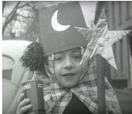
Foto: Fragment uit een reportage over Driekoningen te Balen eind jaren 50.

De k.ERF regio heeft heel wat gezongen erfgoed, dat stond al vast. Toch hebben wij tijdens ons onderzoek enkele zeldzame en aparte tradities teruggevonden die zelfs ons verbaasden. Wist je bijvoorbeeld dat in de 19 de eeuw de volwassen mannen van Vorst (Laakdal) van deur tot deur gingen met een geketend monster? Op oudjaarsavond trok de groep door de straten met in hun handen touwen en kettingen waarmee ze het “beest” (een van hun vrienden in verkleedkledij) in bedwang hielden. Er werd niet gezongen voor geld maar voor (alcoholische) drank.