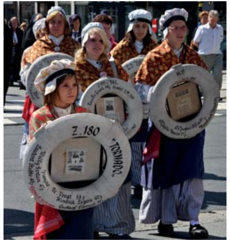
In Heist dragen de Klakkertjes de boeien met de namen van de overleden vissers. (2008)

De geschiedenis van de zeezegeningen en vissersmissen laat zich sowieso niet lezen als een constant