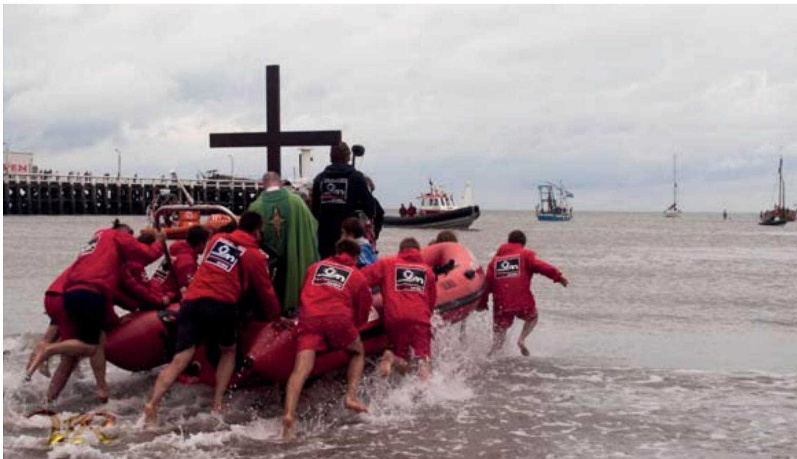
In Blankenberge gaat de deken met de redders op zee. (2014)

De vissersmissen en zeezegeningen zijn niet de enige vorm van volksdevotie aan de kust: in vissersmidens worden ook andere gebruiken in ere gehouden. Zo trekken mensen uit de vissersgemeenschap nog vaak naar een visserskapelletje om te bidden of een kaarsje voor dierbare overledenen te ontsteken. Dergelijke kapellen zijn te vinden in Koksijde, Nieuwpoort, Lombardsijde, Wenduine en Heist, al is de bekendste zonder twijfel die van Bredene. In het verleden was het ook gebruikelijk om in deze kapelletjes ex voto's te offeren. Het schenken van zulke kleine voorwerpen in was of zilver had net hetzelfde doel als het uitspreken van een zegen over de zee: het was een manier om God te vragen om over de vissers te waken. Op bedevaart gaan naar de kapel was dan weer een manier waarmee vissers God bedankten als ze ongevarend uit een storm kwamen. Tegenwoordig offert de vissersgemeenschap geen ex voto's meer; de vissersbedevaarten zijn er wel nog steeds.