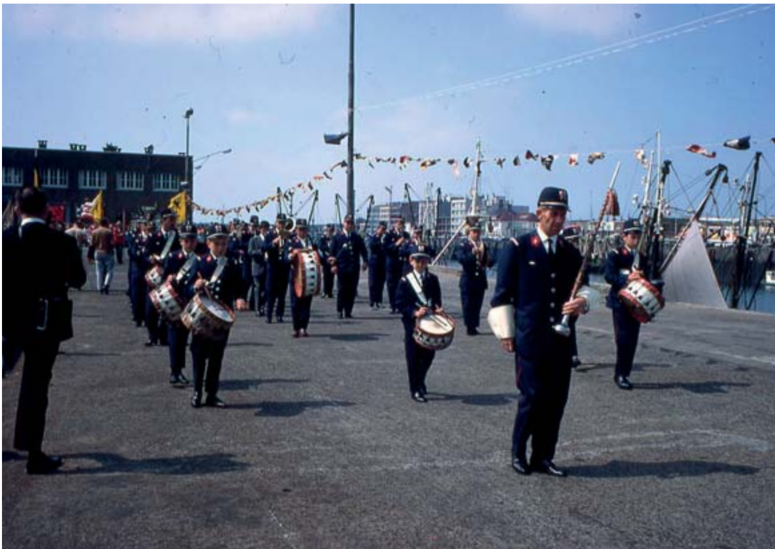
De Zeewijding in Zeebrugge

OVER DE ZEEZEGENINGEN EN VISSERSMISSEN VROEGER EN NU